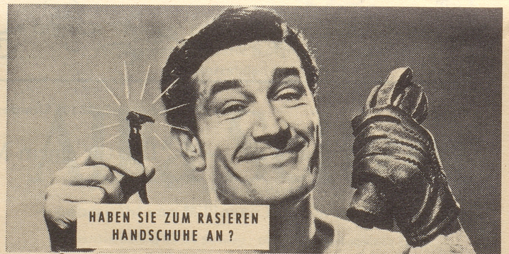
Photo-Max AG, Bürohaus Oerlikon, Zürich 50, Schaffhauserstrasse 359

auf allen Photoartikeln. Kameras, Filme, Projektoren. Gratis-Katalog und Preisliste verlangen.