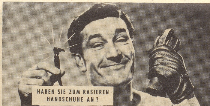
Photo-Max AG, Bürohaus Oerlikon, Zürich 50, Schaffhauserstrasse 359

auf allen Photoartikeln. Kameras, Filme, Projektoren. Gratis-Katalog und Preisliste verlangen.