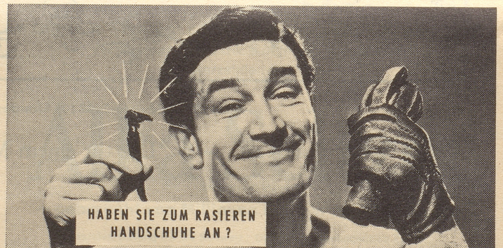
Photo-Max AG, Bürohaus Oerlikon, Zürich 50, Schaffhauserstrasse 359

GANZ NEU! Nur noch Freude am Rasieren dank dem ganz neuen RASIERAPPARAT « PAL GOLDEN INJECTOMATIC » mit den acht wirklich geprüften Vorteilen: