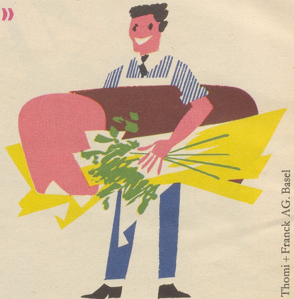
Thomi + Franck AG, Basel

Überall in unserem Lande machen tüchtige Metzger wundervollen Fleischkäse, den man viel zu wenig schätzt. Manche stellen sogar mehrere Sorten auf, von denen der etwas gröbere «Bauernfleischkäse» vielleicht noch vorzuziehen ist. Wussten Sie, dass man aus solchem Fleischkäse eine Spezialität bereiten kann, die es mit mancher berühmteren an Wohlgeschmack und Rasse aufnimmt? Uns hat ein grosser Kenner darauf aufmerksam gemacht und wir fanden sie so ausgezeichnet, dass wir beschlossen, sie sofort bekannt zu machen. Und wenn Sie dann ausrechnen, was Sie dieses grossartige Gericht kostet, so werden Sie auch hinter das Geheimnis seines hübschen Namens kommen.