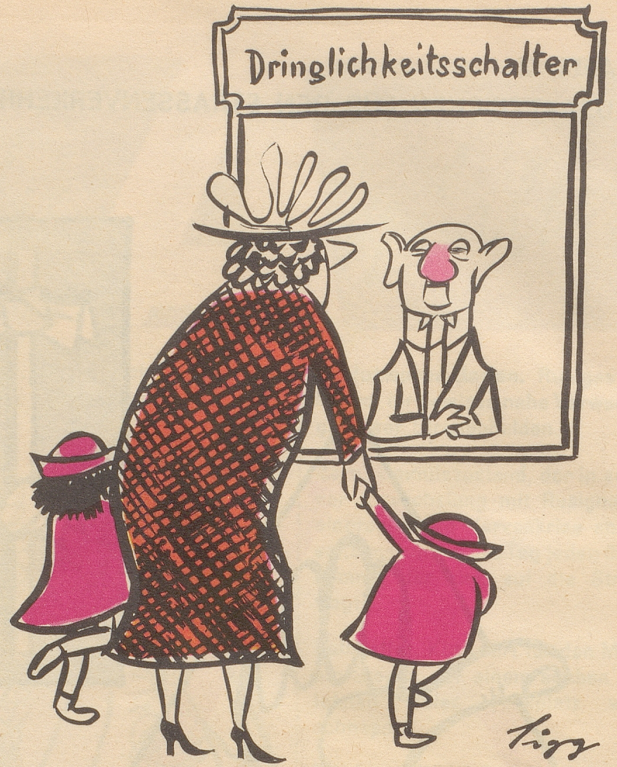
«Erlaubezi di chliine sötted - - - wo gaats dure?»

In diesem Bad fällt alle Last des Tages ab.