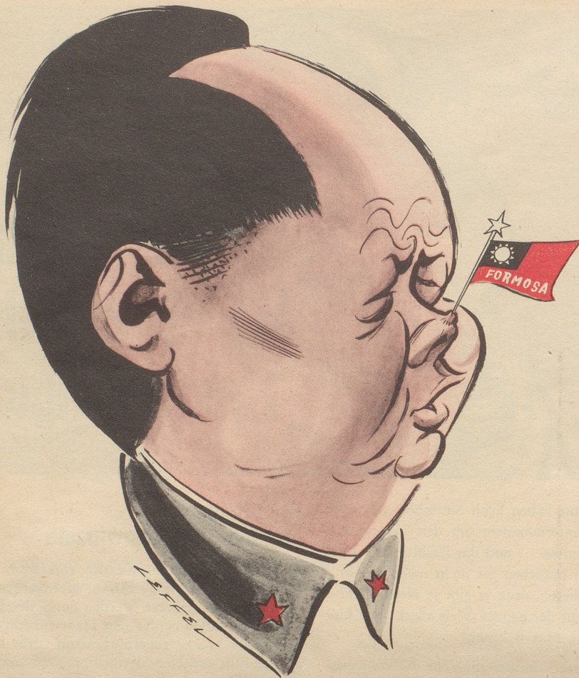
Das Portrait der Woche: Mao-Tse-Tung