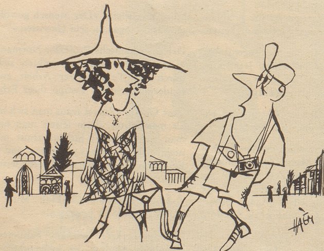
Pisa werde ich nie vergessen