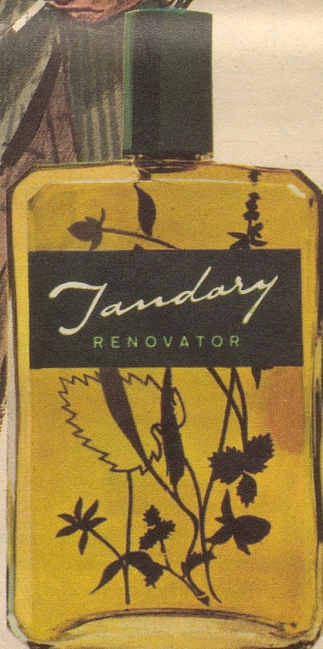
JANDARY Renovator grün ist die bevorzugte Sorte. Mit oder ohne Fett. Ihr Coiffeur macht Ihnen gerne eine Fraktion mit dieser hervorragenden, rein pflanzlichen Lotion. Fr. 3.25, Fr. 6.25