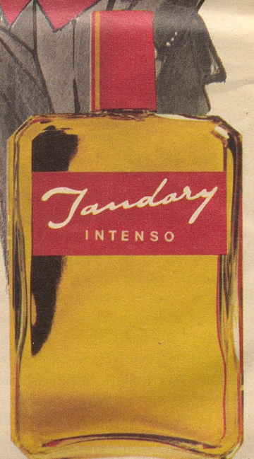
JANDARY Intenso (Spezial-Formel) ist das erste selbstmassierende Haar-tonikum, das auf der Grundlage einer Durchblutungssteigerung der Kopfhaut den Haarboden stärkt und damit einen milden Haarwachstums-reiz auslöst. Fr. 6.25