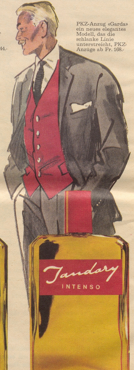
PKZ-Anzug «Garda» ein neues elegantes Modell, das die schlanke Linie unterstreicht, PKZ-Anzüge ab Fr. 168.-