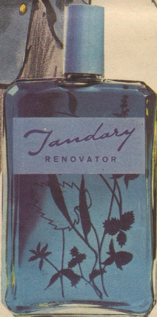
NEU: JANDARY blau Für jedes Haar, speziell aber für graues und weisses Haar. Auch diese Sorte enthält die natürlichen Pflanzenextrakte, welche seit Jahren den Erfolg von Jandary begründen. Fr. 3.25, Fr. 6.25