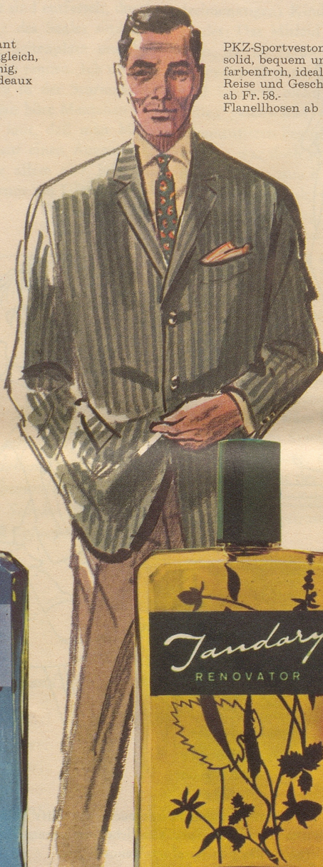
PKZ-Sportveston solid, bequem und farbenfroh, ideal für Reise und Geschäft, ab Fr. 58.- Flanellhosen ab Fr. 44.-