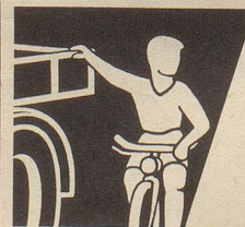
Photo-Max AG, Bürohaus Oerlikon, Zürich 50, Schaffhauserstrasse 359

Nicht nur Sie — auch Ihre Kinder brauchen eine Unfallversicherung!