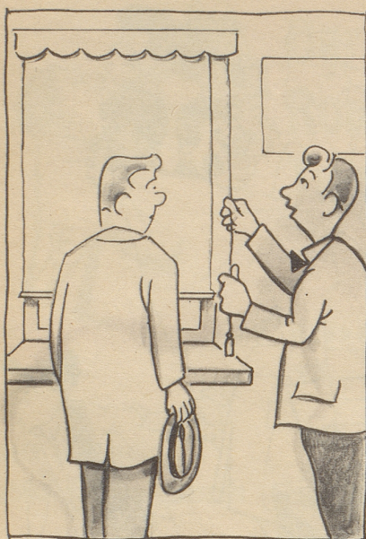
Das isch min Fernseh-