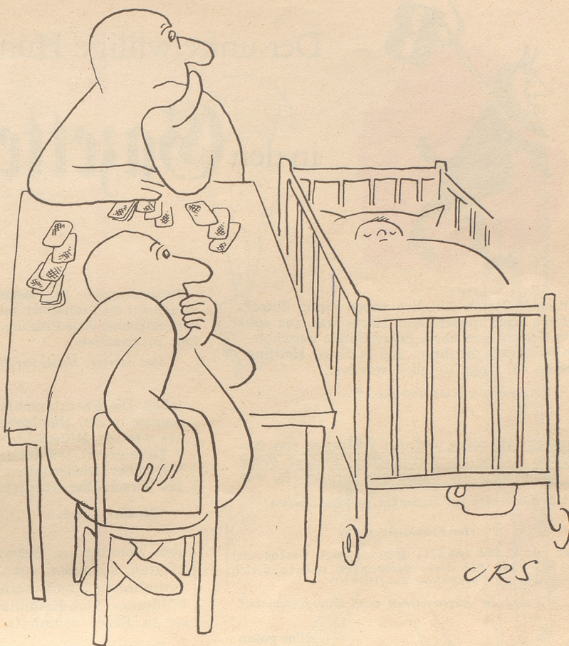
Sie warten auf den dritten Mann

Bezugsquellennachweis: E. Schlatter, Neuchâtel