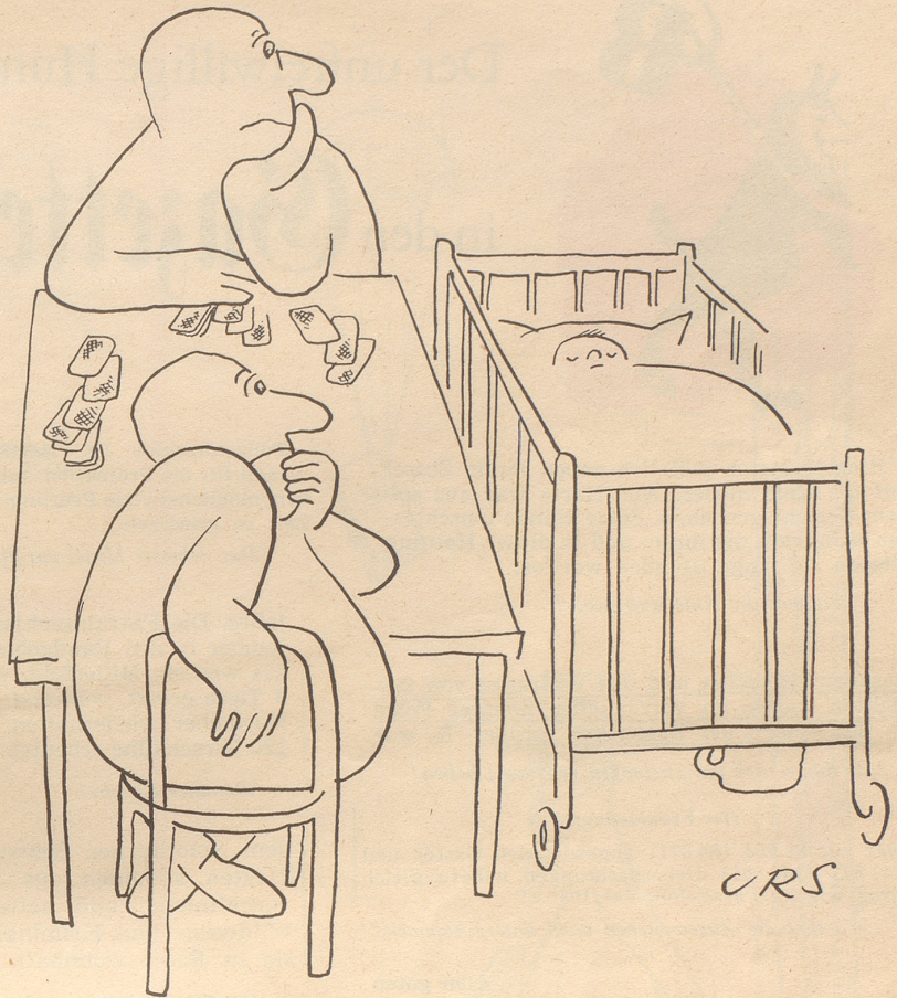
Sie warten auf den dritten Mann

Bezugsquellennachweis: E. Schlatter, Neuchâtel