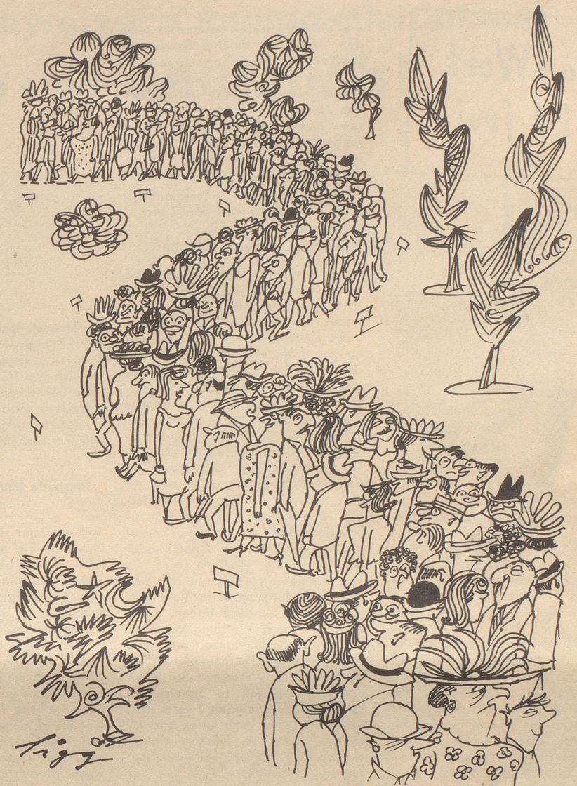
Hundstag in den Anlagen