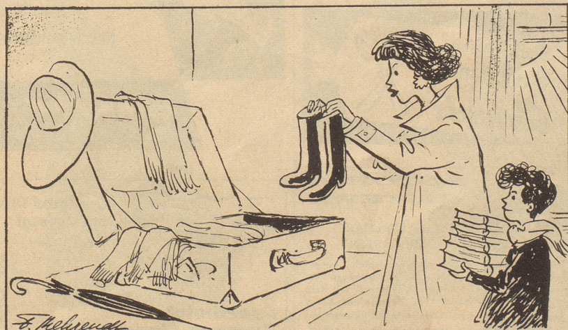
... und von Italienern nach Mittel-Europa