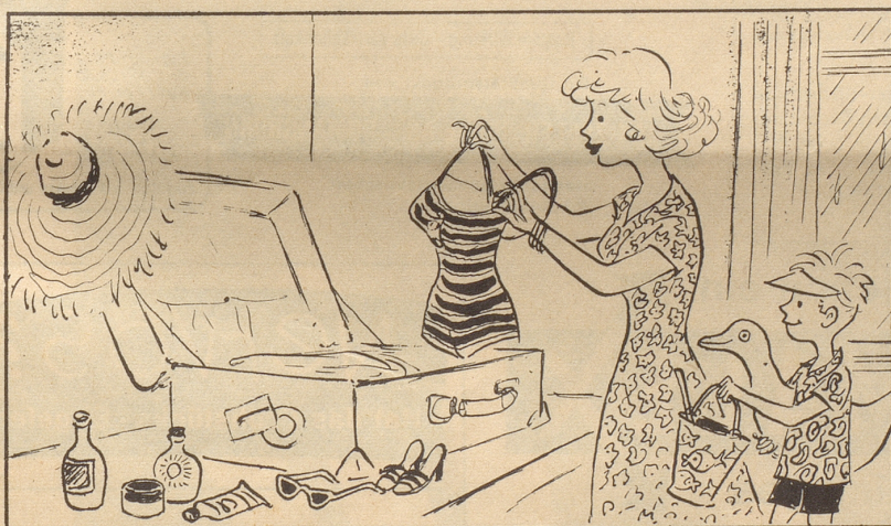
Feriengepäck von Mittel-Europäern nach Italien ...

Präsident Nasser hat das von einer westdeutschen Firma gebaute erste Stahlwerk Ägyptens eingeweiht und dabei, wie es unter Diktatoren Usus ist, gleich mit dem Endprodukt des Werkes, mit den Waffen, gerasselt. Ja, Diktatoren und Stahl, das ist eine innige Freundschaft! Zuerst haben die Despoten den Stahl im Kopf und eines Tages unweigerlich zwischen den Rippen.