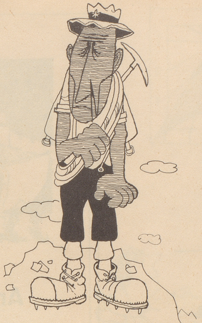
Berge und Menschen