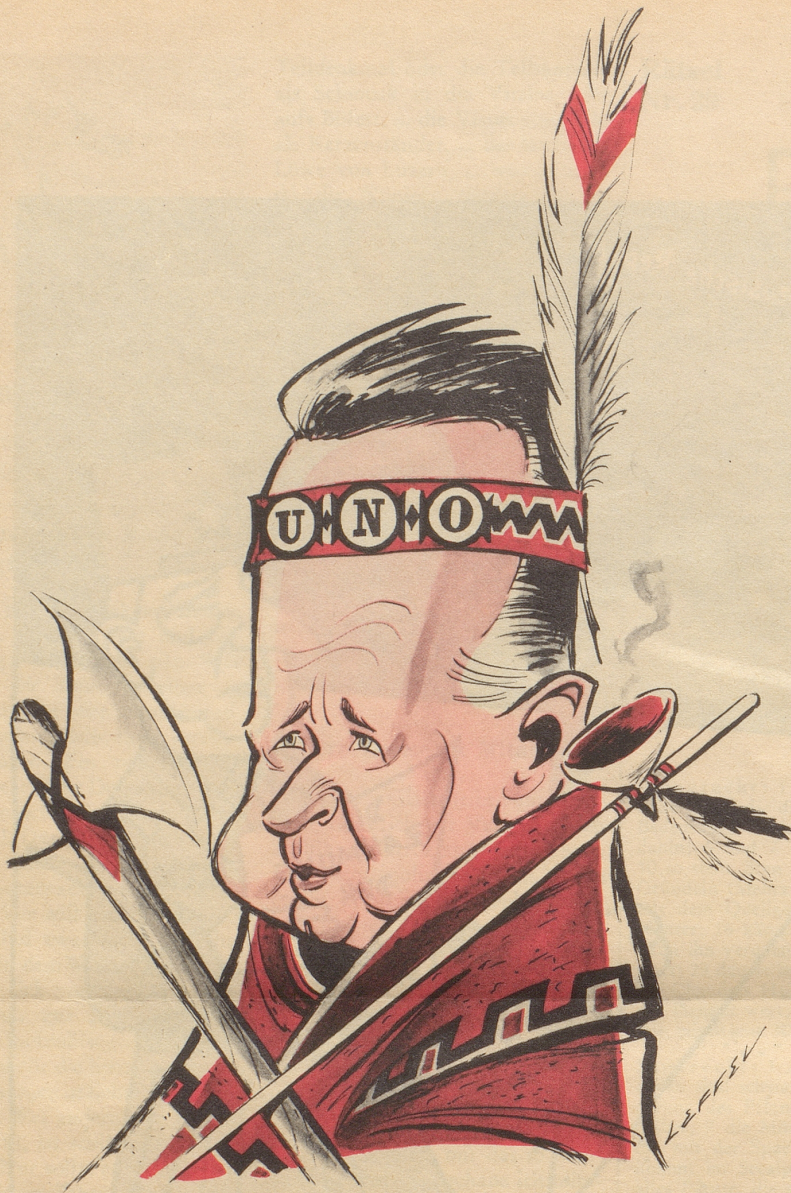
Das Portrait der Woche: Mister «H» Hammarskjöld