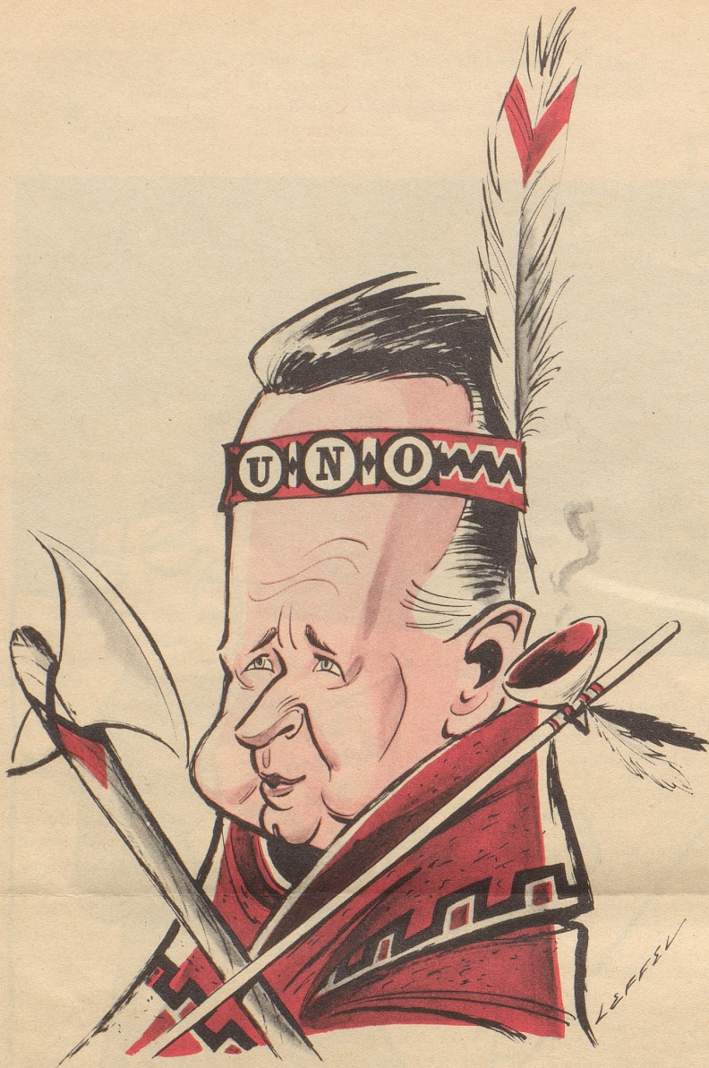
Das Portrait der Woche: Mister «H» Hammarskjöld