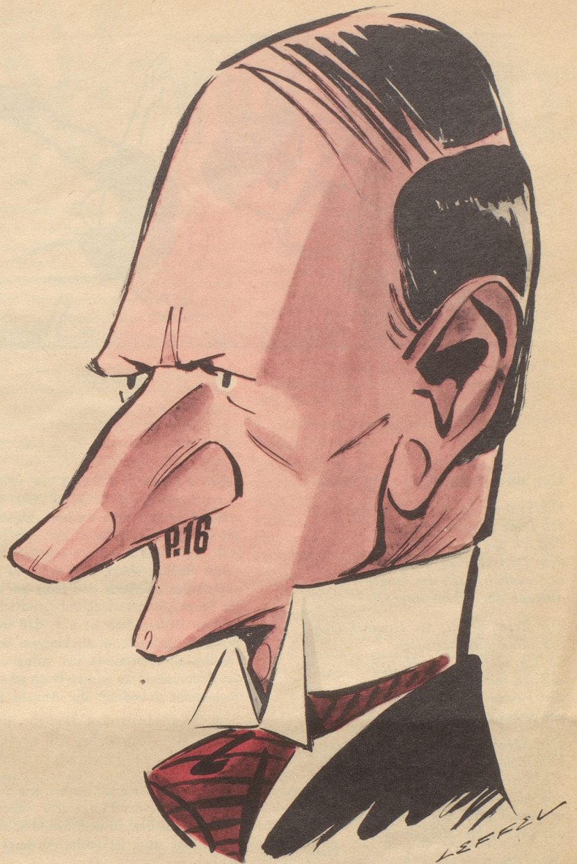
Das Portrait der Woche: Mr. «P-16»