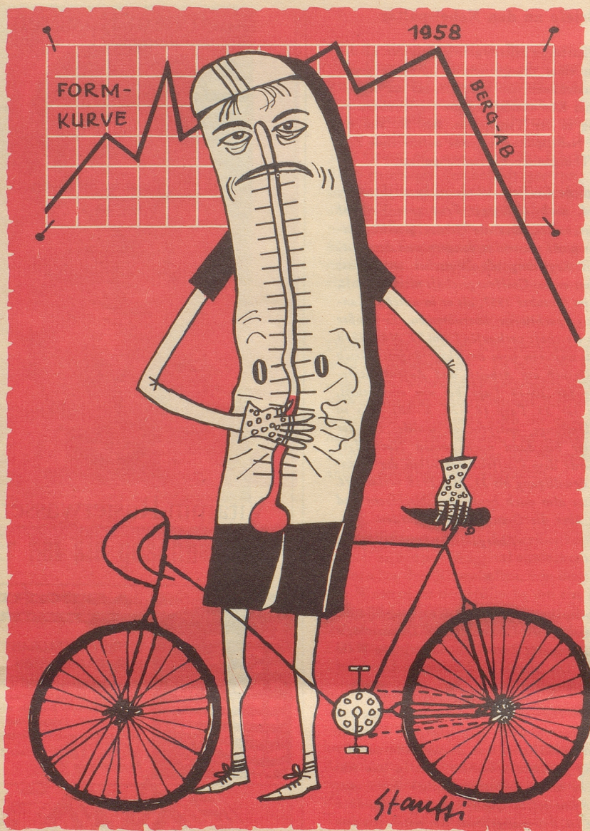
Frühjahrmüdigkeit im Schweizer Straßenradspport!