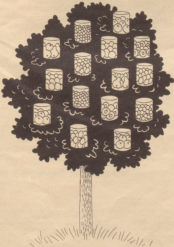
Der Idealbaum der modernen Hausfrau