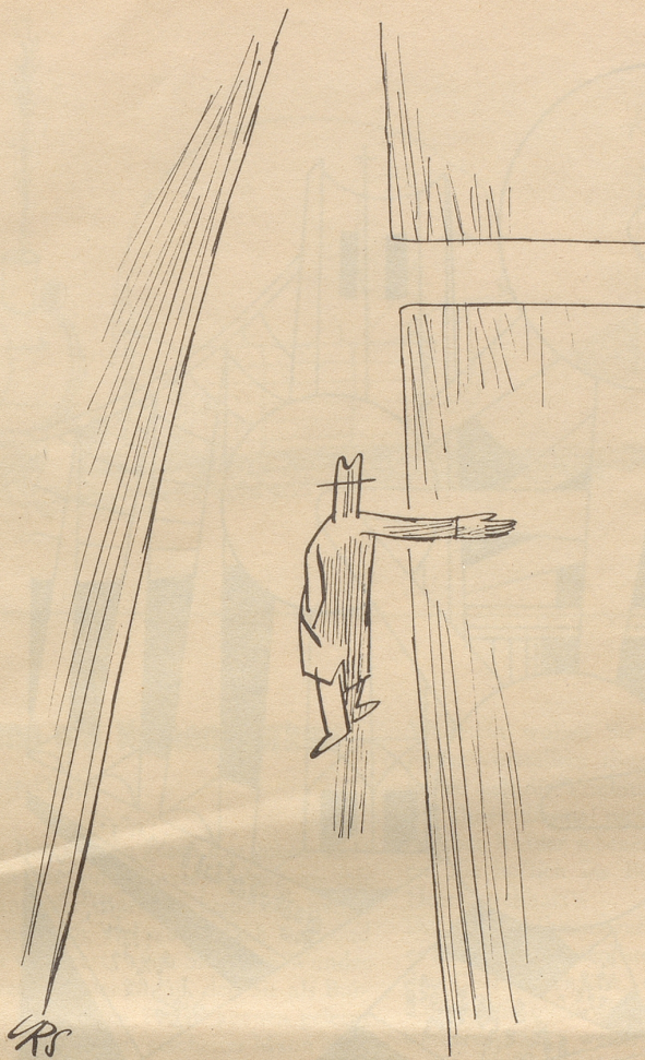
Fahrer zu Fuß