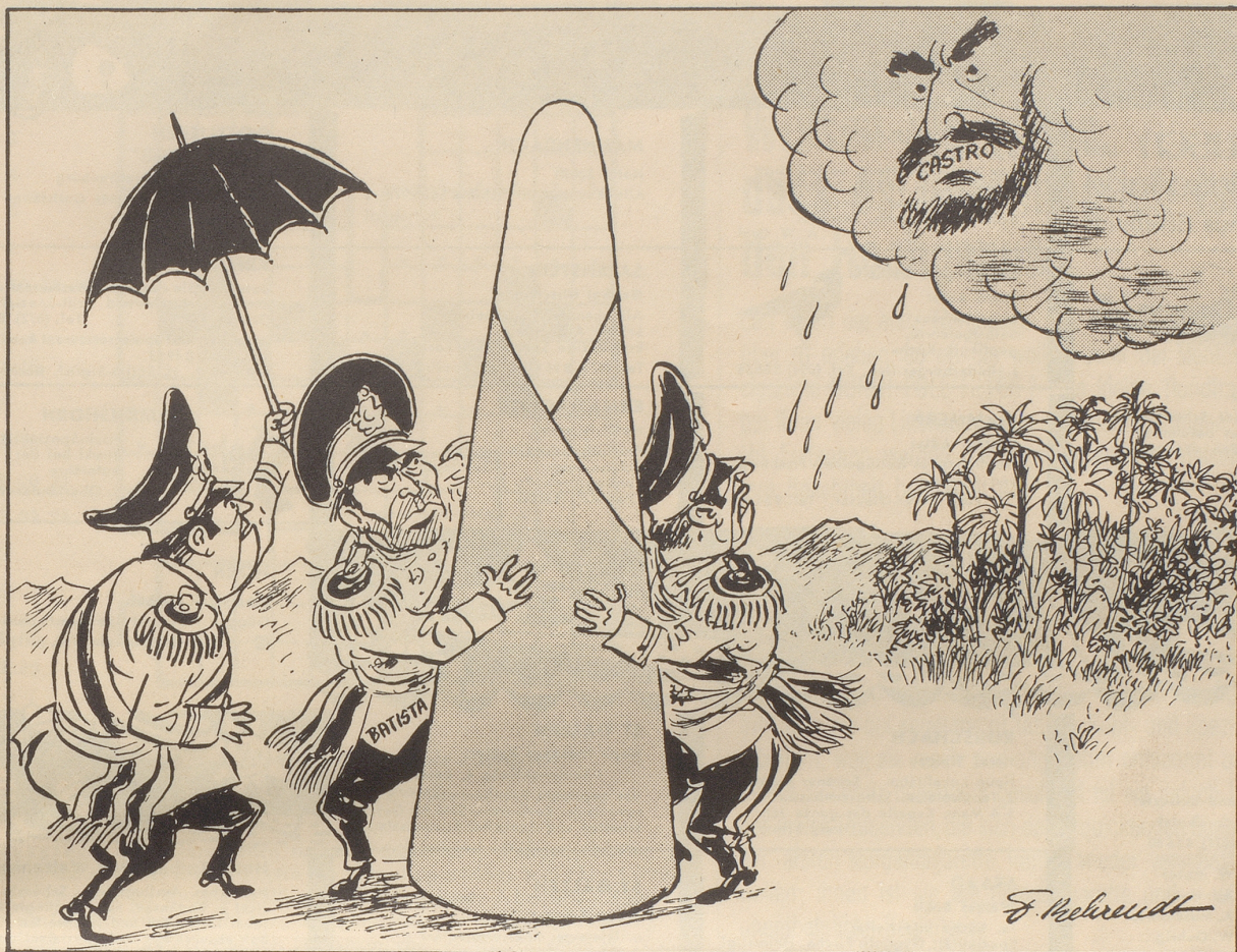
Gewitter- wolke über Kuba