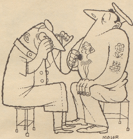
Lula aus Hawaii