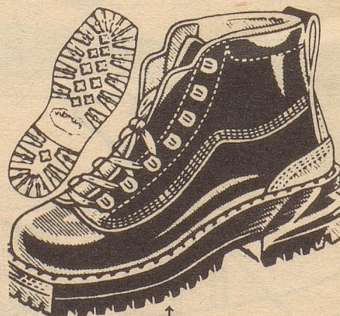
041. Wuchtiger Ski- und Bergschuh aus bestem schwarzem Waterproof, ganz mit Leder gefüttert. Weich gepolsterter Schaft, mit solider Versenkappen-Verstärkung. Abdichtender Talon...