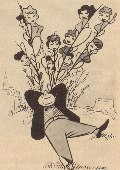
Junggesell sieht Palmkätzchen

Inmitten dürrer Matten, die einst stolze Häuser trugen, waren Deine kläglichen Reste stehengeblieben, liebe alte Münchner Pinakothek. Einsam ragtest Du in der trostlosen Leere, die Dich umgab, und der Wind weinte und wimmerte wehmütig durch Deine ausgebrannten Hallen, in denen sich vor noch garnicht langer Zeit die üppig fleischeslust-betonte Schar Rubensscher Gestalten auf der Leinwand tummelte. So also mußte ich Dich wiedersehen. Wie aber durfte ich Dich letzten Sommer wieder begrüßen! Ein Stab Architekturbegeisteter hatte sich Deiner angenommen, und also leuchtest Du mir maximal frisch entgegen, Du, die noch vor kurzem in der matten Dürre des Ruinentums geseufzt.