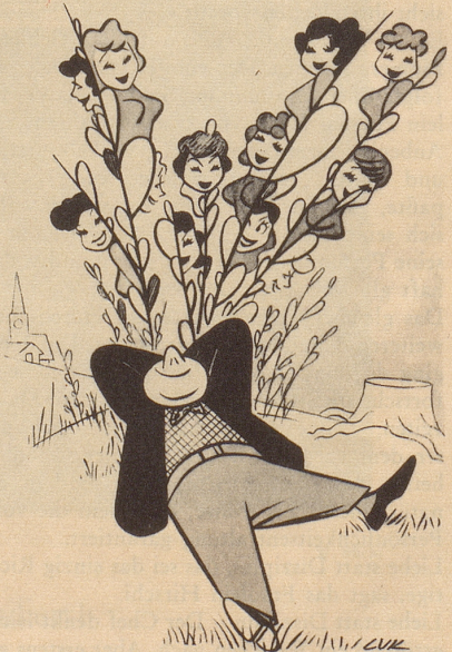
Junggesell sieht Palmkätzchen

« Sie gänd also zue daß Sie z Nacht am drü i das Huus vo dr Frau Bürzli ine gschliche sind. » « Jo aber ich ha drum gmeint ich sig i mim Huus, i ha halt e chli höch gha. » « Soso, werum sind Sie dänn fluchtartig furt gschprunge, wo Pfrau Bürzli cho isch? » « Ich ha gmeint es sig mi Frau. »