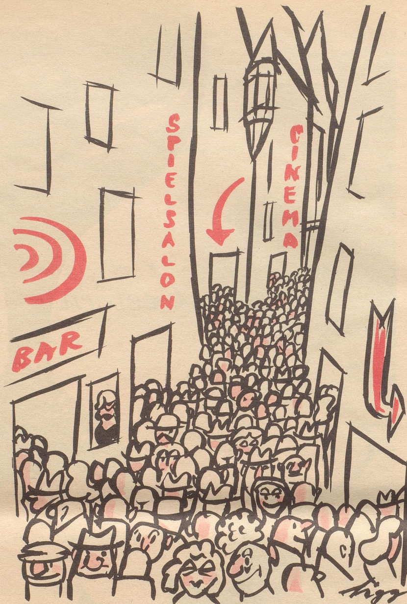
Das Vergnügen am Samstagabend

Einmal dachte ich nicht daran und erhielt 900 Gramm.