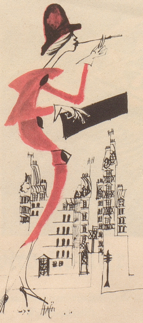
Die modische Haltung für 1958

Jetzt Lebewohl auch flüssig, speziell gegen Warzen.