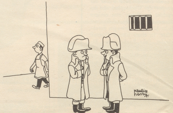
«Und Sie, was glauben denn Sie, wer Sie sind?!»