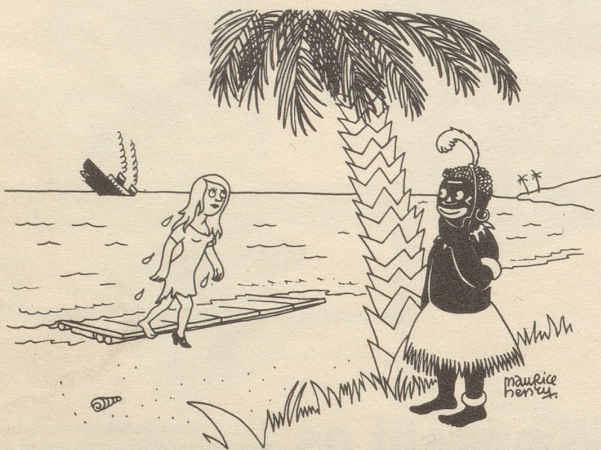
«Soll ich sie zum Essen einladen, oder soll ich sie essen?»