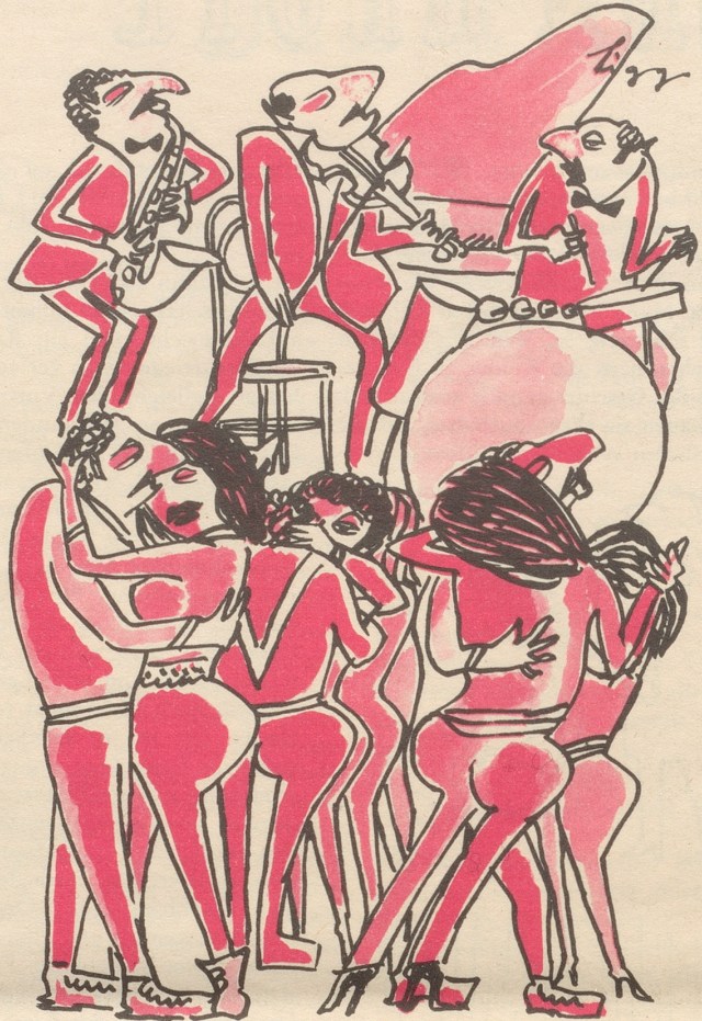
«Der Tanz, künstlerisches Ausdrucksmittel!»