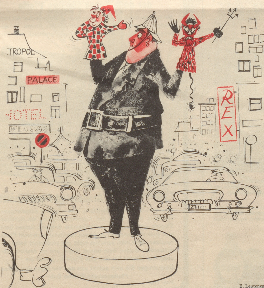
Der Polizist mit fasnächtlichem Humor

Der Vater, nach langem, heftig wogendem Seilziehen, zum künftigen Schwiegersohn (pathetisch): «Nun – so sei's denn – ich gebe dir meine Frau zur Tochter!» Tatsächlich erlauscht von pin.