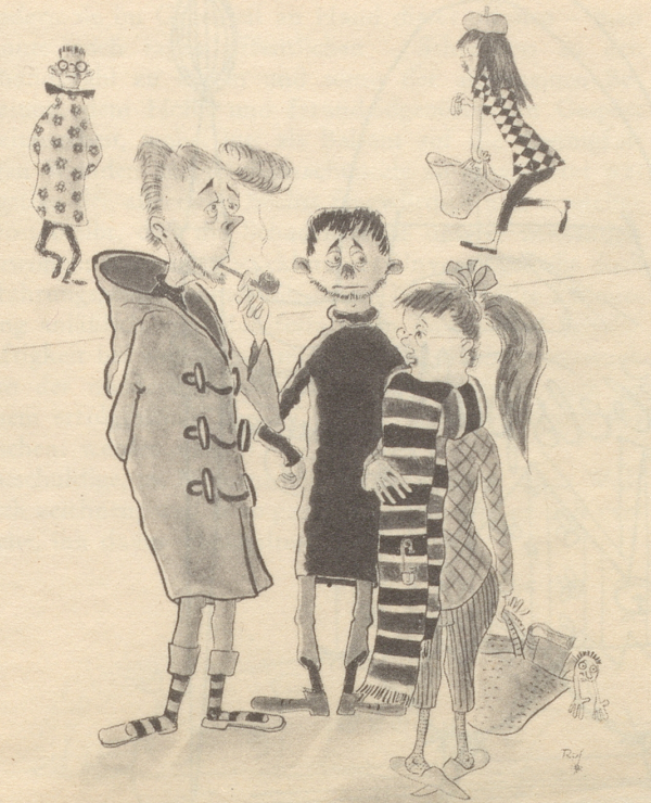
Probleme der Halbstarke