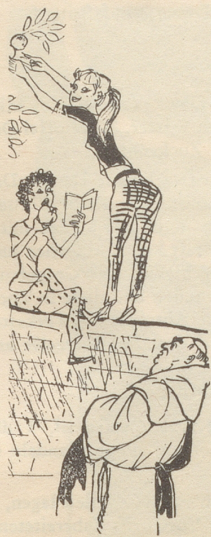
Aus „Skandalitis von A-Z“

Schicken Sie bitte vorher die Kinder und die Damen aus dem Zimmer: