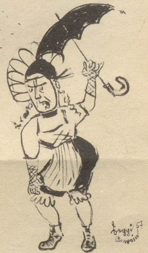
De Krienser Deckel Typische Innerschweizer Fastnachtfigur