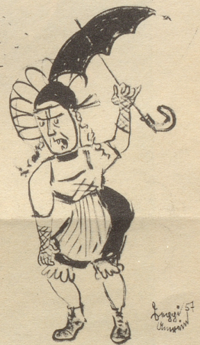
De Krienser Deckel Typische Innerschweizer Fastnachtfigur