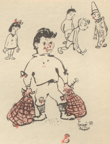
Orangen aus dem Fritschiwagen Der Sieger: 21 Kilo 500