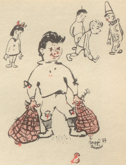
Orangen aus dem Fritschiwagen Der Sieger: 21 Kilo 500