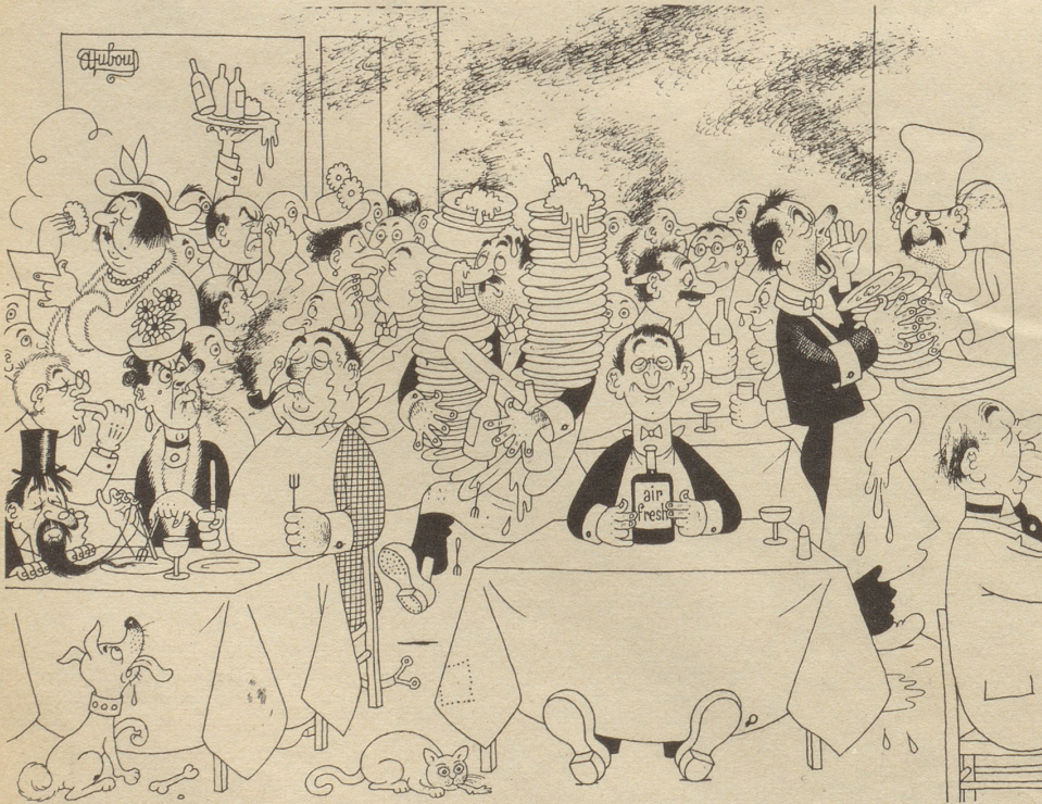
Glücklich ist, wer air-fresh kennt

Adresse für Einsendungen: Textredaktion Nebelspalter, Rorschach.