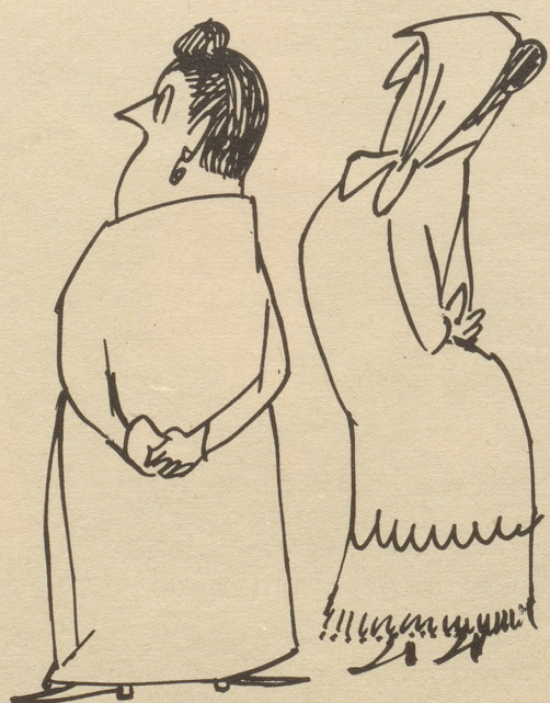
«Nüdemal Grüezi sait er eim!»