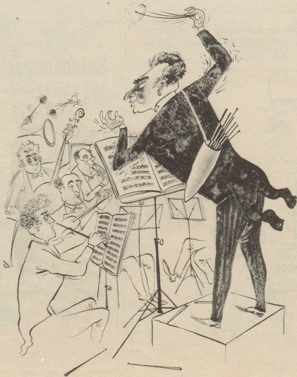
Der temperamentvolle Dirigent

Dafür, liebe Schbörpfreunde, laßt uns hundert Jahre weiterkämpfen! AbisZ