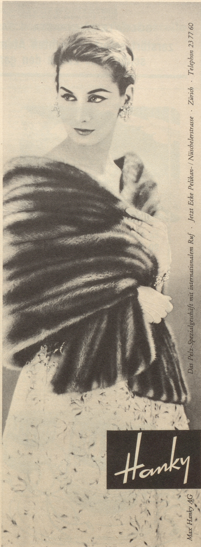
Das Pelz-Spezialgeschäft mit internationalem Ruf · Jetzt Ecke Pelikan- / Nüsselerstrasse · Zürich · Telefon 23 77 60

Im gleichen Sinne hat sich ein deutscher Buchhändler, der seit 30 Jahren in Florenz lebt und den ich diesen Sommer in Sardinien kennen gelernt habe, geäußert. Er hat sich über das arrogante Verhalten seiner Landsleute, die als Touristen Italien, einschließlich Sardinien, überfluten und von denen einige ihre Anwesenheit damit begründeten, daß sie während des Krieges als Soldaten hier gewesen seien und nun wiederum einen «Freundschaftsbesuch» abstatten wollten, nicht weniger geärgert als ich. H. K.