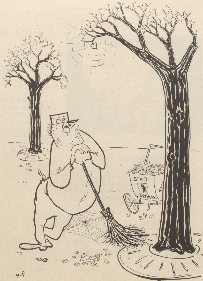
«I ka jo warte!»