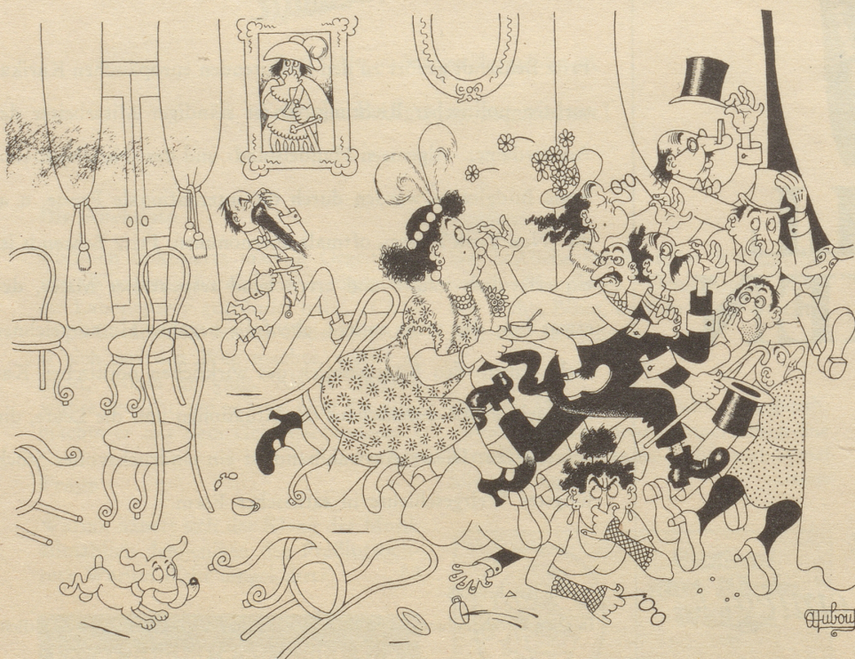
Der Gastgeber hat air-fresh vergessen!

«EUMIG» Kunz + Bachofner, Grütlistraße 44, Zürich 2 / Telefon (051) 25 15 27