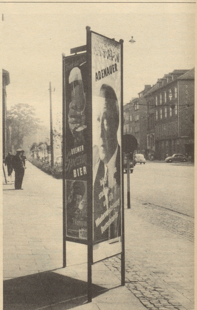
Adenauer feiert das Wahlergebnis