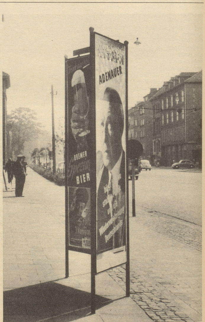
Adenauer feiert das Wahlergebnis