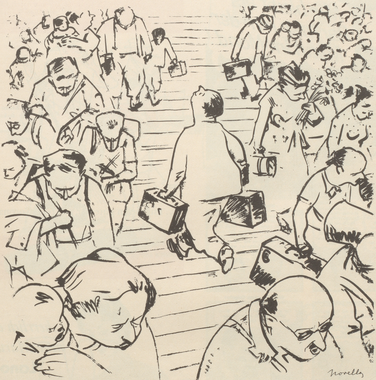
Der Herr, der in die Ferien geht, wenn alle andern zurückkommen.