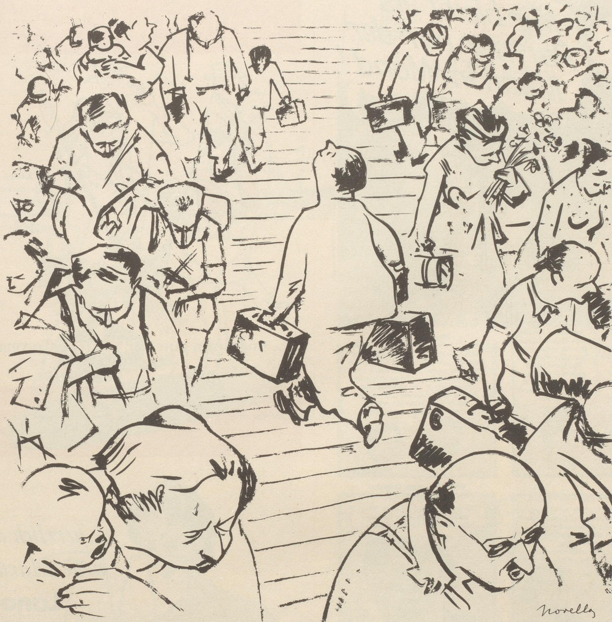
Der Herr, der in die Ferien geht, wenn alle andern zurückkommen.