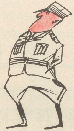
Rekrut fährt in Urlaub Ein Tatsachenbericht

«Herr Hauptme wänd Si es shtückliwiit mipfahre?»