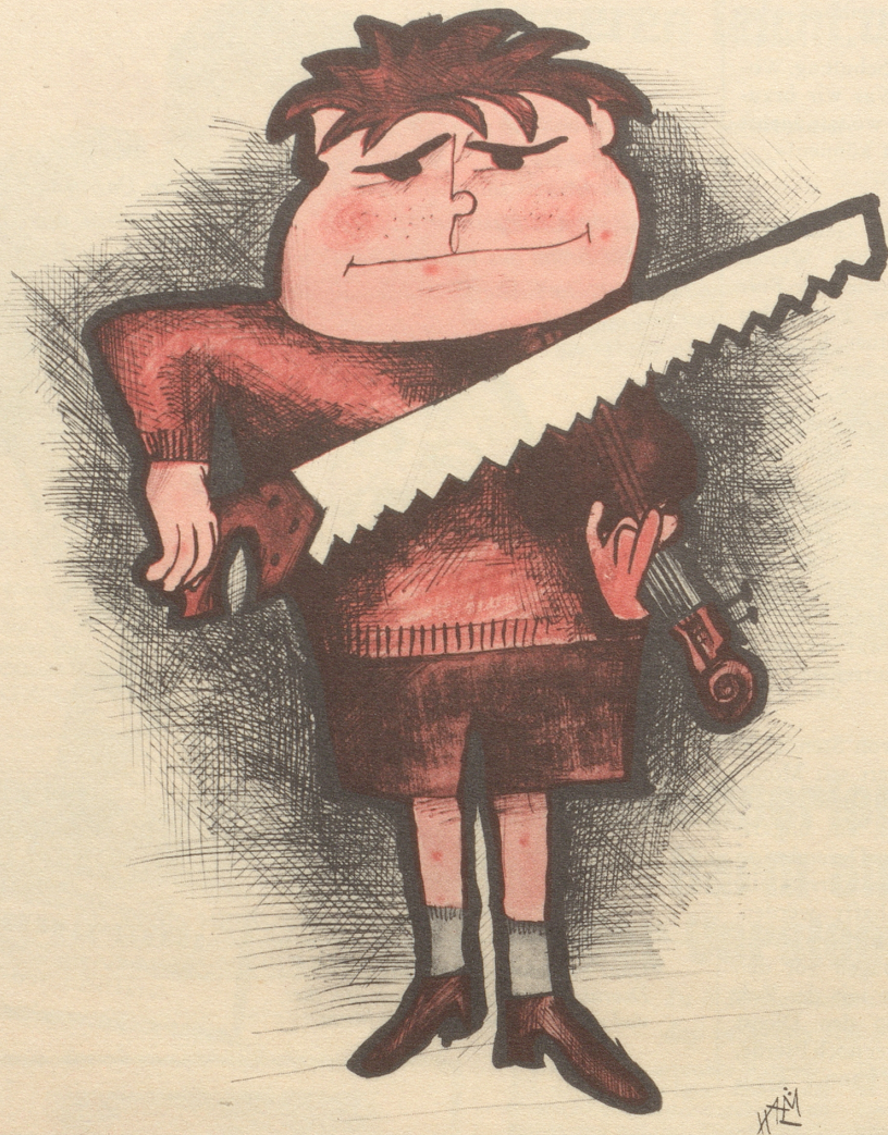
Mir isch vertleidet!