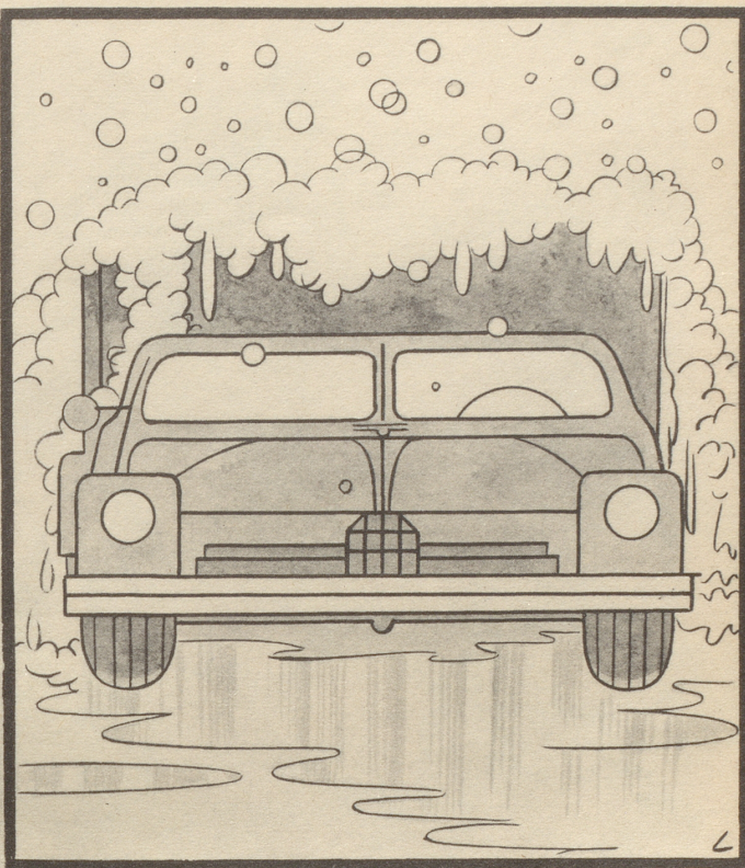
Ein Auto mit Seife kam in einen Platzregen...