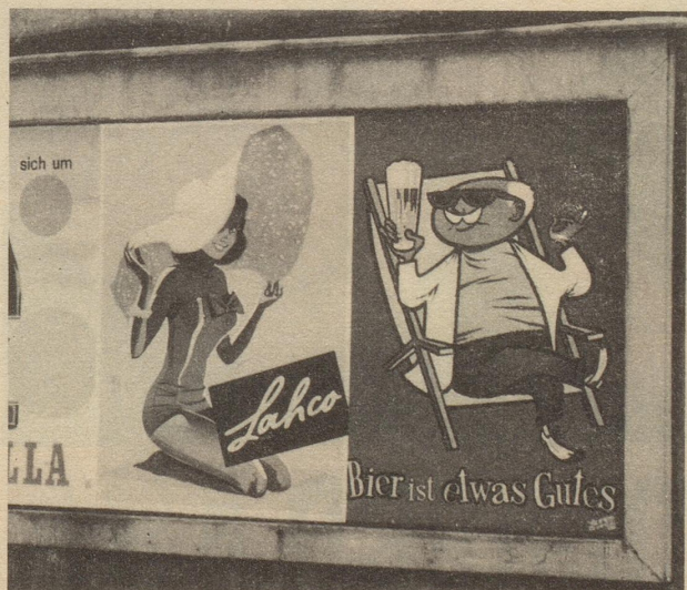
« Auf gute Nachbarschaft! »