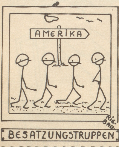
« Abzieh-Bild »