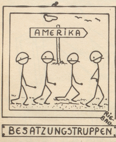
« Abzieh-Bild »