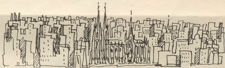
sind nicht mehr!