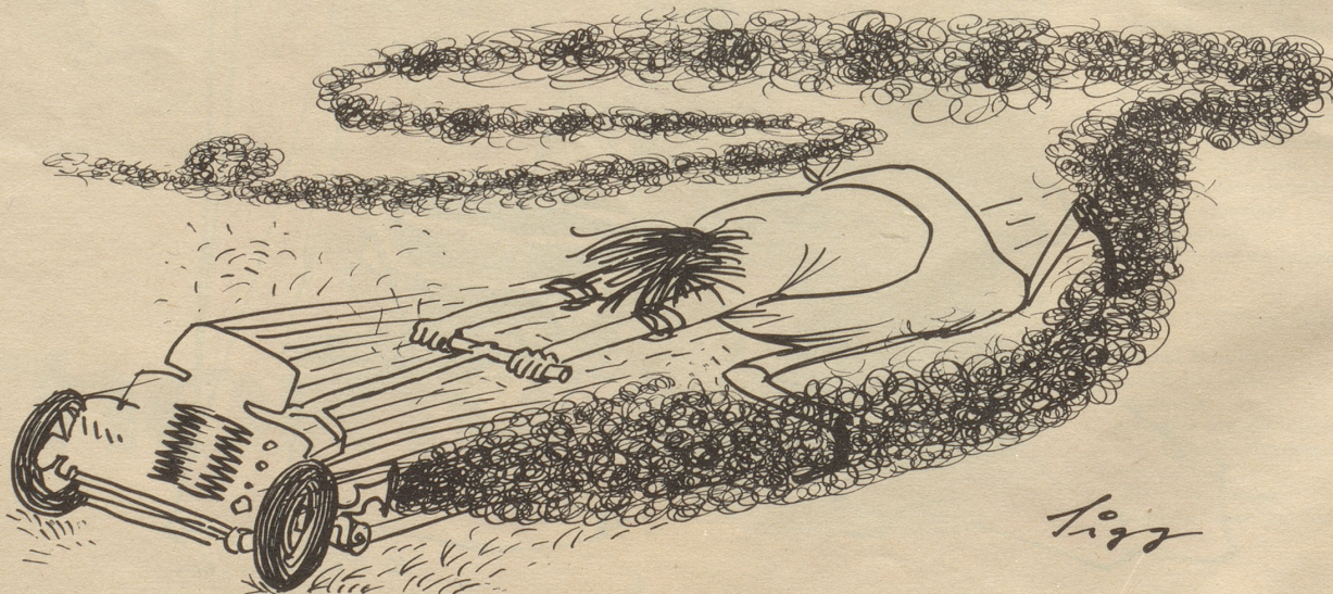
Meine Nachbarin entspannt sich beim Rasenmähen

Die Schrift soll in möglichst viele Hände kommen. Um den Preis dieser Volksausgabe niedrig halten zu können, sind von dieser Publikation 300 nummerierte Exemplare besser ausgestattet und durch die beiden Verfasser handschriftlich mit ihren Namenszügen versehen worden. Diese Vorzugsausgabe ist beim Verlag zu Fr. 5.– zu beziehen. Wer also den bibliophilen Preis bezahlt, hilft mit, die Streuung der Volksausgabe zu erleichtern.