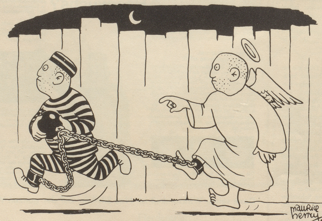
Das bessere Ich

Redaktoren und Mitarbeiter des Nebelspalters