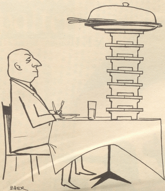
Der Gast, der gern warm isst